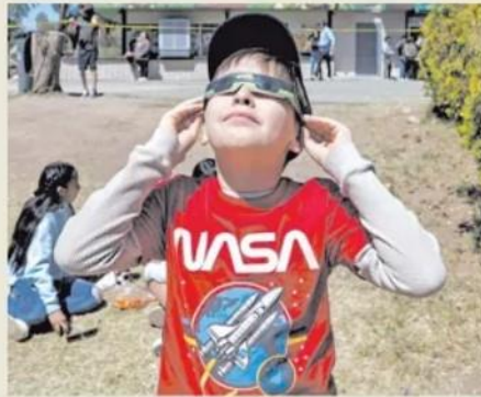
El eclipse fascinó a los cachanillas, sobre todo a los niños.